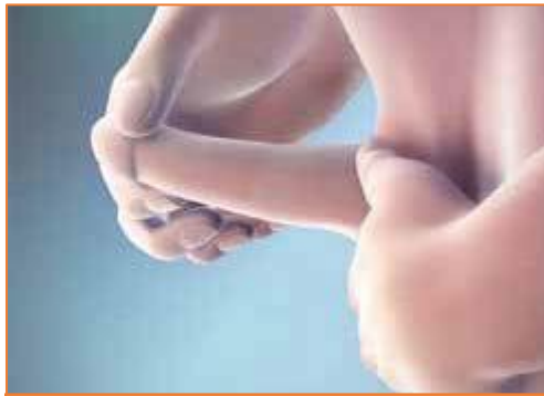
Bočni prikaz aktivnosti istezanja penisa