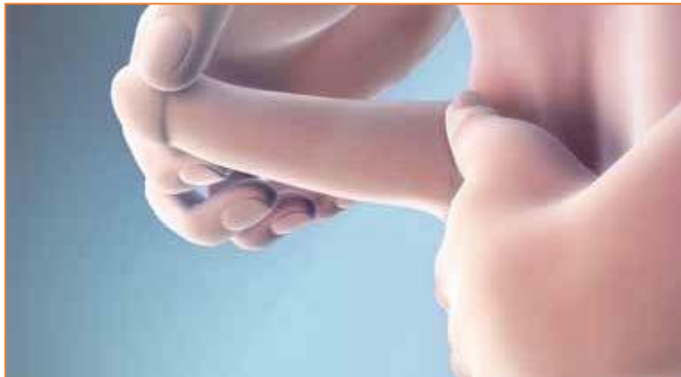
Bočni prikaz aktivnosti istezanja penisa koju treba provoditi triput na dan.

Bolesnici aktivnost ispravljanja penisa smiju provoditi najviše jedanput na dan samo ako dođe do spontane erekcije. Ako kod bolesnika ne dođe do spontane erekcije, ne bi smio provoditi ispravljanje penisa.