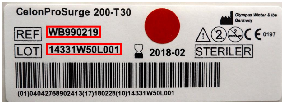
Slika 4.: broj modela (REF) i serije (LOT) na naljepnici blister pakiranja