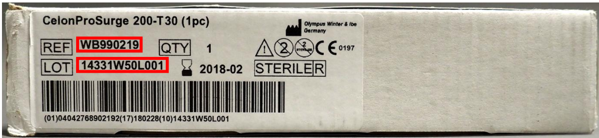
Slika 2.: broj modela (REF) i serije (LOT) na naljepnici vanjskog pakiranja (bočni prikaz)