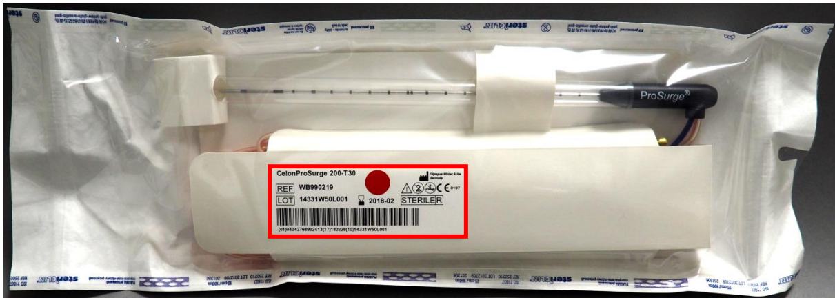
Slika 3.: blister pakiranje bipolarnih aplikatora