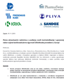
Pismo zdravstvenim radnicima

Kao zdravstveni radnik možete primiti sigurnosne informacije o lijekovima kao što su Pisma zdravstvenim radnicima, komunikacija od strane nacionalnog regulatornog tijela ili edukacijski materijali. Ove se informacije šalju na različite načine i iz različitih izvora. Poznato je da različiti čimbenici mogu utjecati na to hoće li zdravstveni radnik tijekom svojeg svakodnevnog rada poduzeti posljedice aktivnosti. U ovom odjeljku željeli bismo Vam postaviti pitanja o načinima i izvorima [pošiljateljima informacije] koji Vam odgovaraju te o čimbenicima koji mogu uti na kako postupate vezano uz sigurnosne informacije koje ste primili.