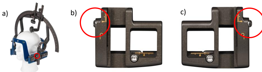
Slika 1 a) Leksell Vantage Stereotactic System. b) Desni klizač luka c) Lijevo klizač luka tamo gdje su vijci za zaključavanje ljestvice osi Z zaokruženi crvenom bojom.

Leksell Vantage Arc System dio je sustava Leksell® Vantage Stereotactic System koji se upotrebljava za stereotaktičke neurokirurške intervencije (Sl. 1, Lijeva strana). Sustav Leksell Vantage Arc sadrži lijevo klizač luka i desno klizač luka. Svaki od njih uključuje mehanizam zaključavanja kojim se postavljaju koordinate ljestvice osi Z.