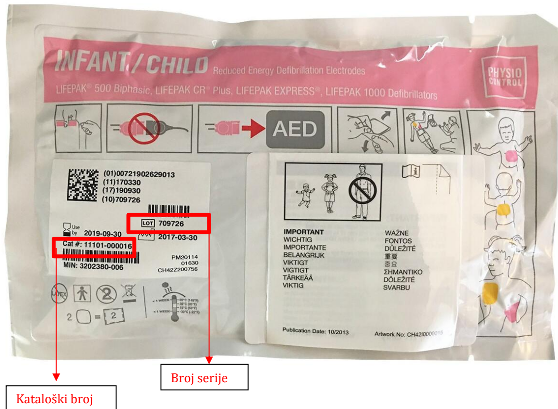
Slika 1 – Lokacija kataloškog broja i serijskog broja