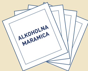
F Paketiće alkoholnih maramica (x 4)