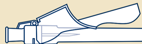
D Sigurnosnu iglu: 27 G*, 13 mm (1)