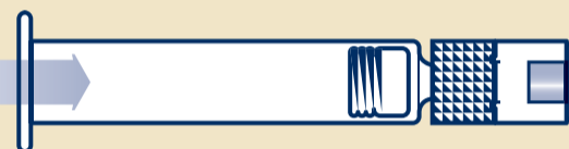
B2 Štrcaljku napunjenu sa sterilnom vodom (1)